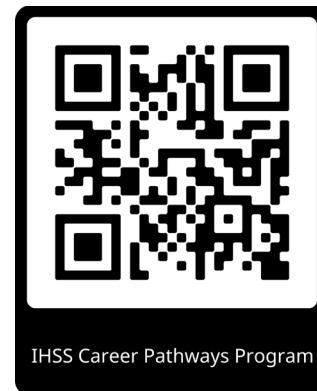
IHSS Career Pathways Program

Further information can be found at or see QR code: https://www.cdss.ca.gov/inforesources/cdss-programs/ihss/ihss-career-pathways-program